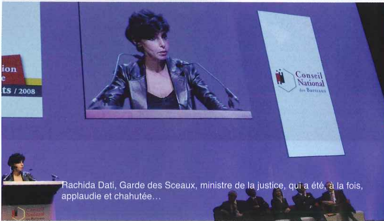
Rachida Dati, Garde des Sceaux, ministre de la justice, qui a été, à la fois, applaudie et chahutée...