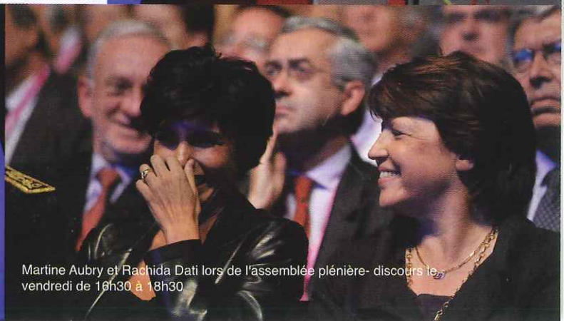
Martine Aubry et Rachida Dati lors de l'assemblée plénière- discours le vendredi de 16h30 à 18h30